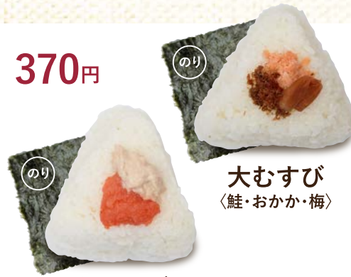
大むすび 〈鮭・おかか・梅〉